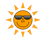
Technologie LED super 'Sunbright'