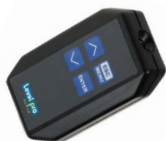
IR Remote Controller RIS-15